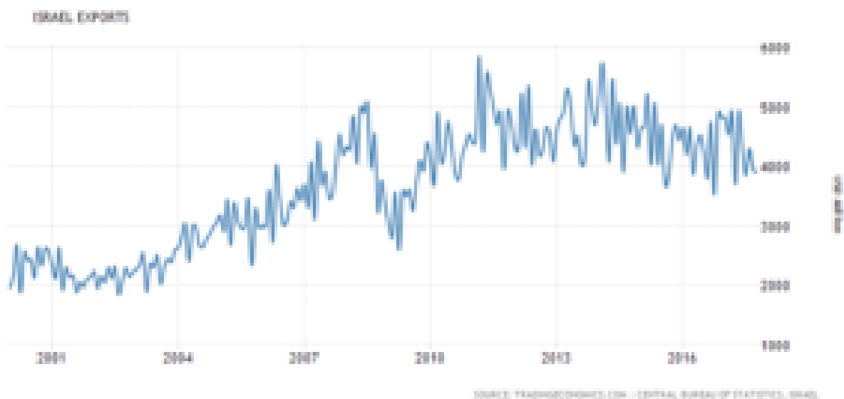
Tab.1 : volume des exportations israéliennes 2000-2017 (en million de $)

Récemment, de nouveaux gisements de pétrole et gaz ont été découverts, ce qui contribue à alimenter un certain optimisme concernant l'avenir de l'économie israélienne. Alors, le lait et le miel ruissellent-ils dans la Terre Promise ? Pas tout à fait.